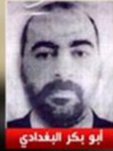
أبو بكر البغدادي